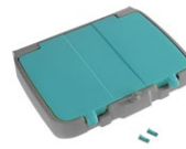
Couvercle compartiment de rangement pour support sac 120 L