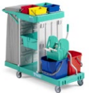
Magic Line 350B