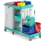
Magic Line 350P