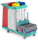
Magic Line 350S7