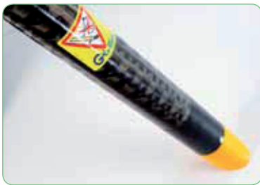
Buse carbone extralégère avec accoudoir