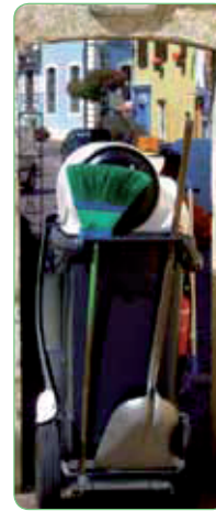
Largeur modulable: 750, 775, 795 mm